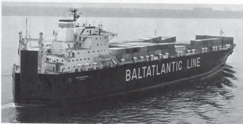
Линейное судно «Карл Либкнехт» Балтийского морского пароходства в порту Гамбург (вторая половина 1920-х гг.).

Фидерная система перевозок – не просто гарантированный заработок для европейских компаний, но и основной элемент системы контроля грузопотока в/из России.