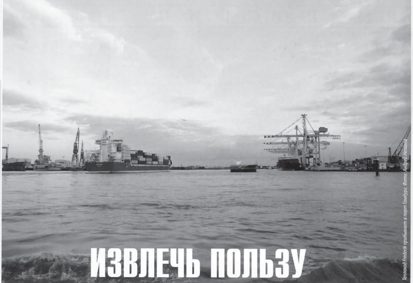
Теплоход Фредерик прибывает в порт Гамбург.